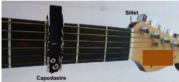
Capodastre placé sur la 3 ème case du manche d'une guitare

Un capodastre est un accessoire que l'on fixe en travers du manche d'une guitare sur une case particulière. De composition très variable (élastique, ressort ou boulon), il raccourcit la longueur de toutes les cordes sans modifier leurs tensions, ce qui crée en fait un nouveau sillet. Toutes les cordes à vide jouent maintenant des tons de hauteur supérieure à ceux qu'elles produisent sans le capodastre.