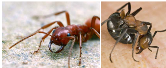
Mandibules de fourmi et fourmi en position de morsure

Les fourmis se défendent en mordant avec leurs mandibules et, pour certaines espèces, en projetant de l'acide formique dans la morsure. La réaction avec l'eau des tissus occasionne des brûlures.