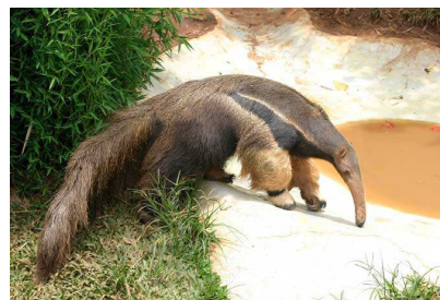
Tamanoir géant ( myrmecophaga tridactyla )

En revanche, l'appareil digestif du tamanoir est différent en raison de son régime alimentaire : il mange jusqu'à 30 000 fourmis par jour !